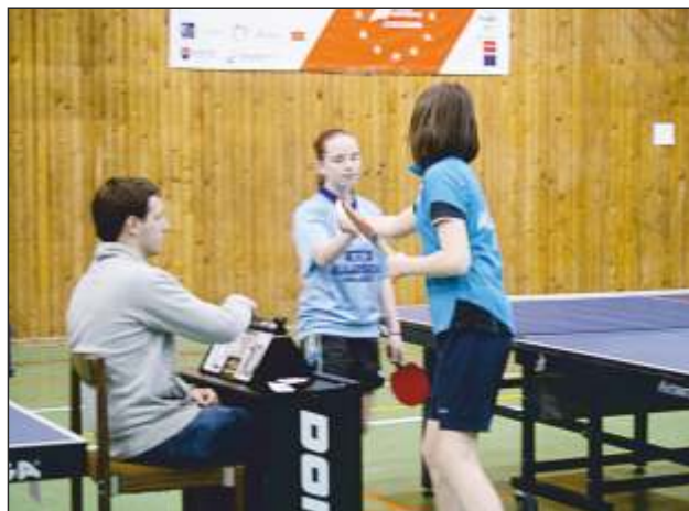
K najaktívnejším organizátorom sa v školskom roku 2014/2015 zaradili Košice. Privítali účastníkov školských M SR v bedmintonе, basketbale i stolnom tenise.