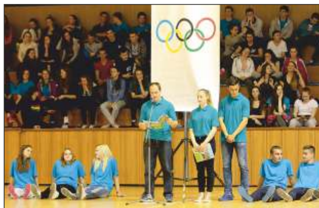
Kalokagatie. Vyhodnotenie výsledkov a vernisáž umeleckých prác je naplánovaná na záver školského roku.

Ako píšeme vyššie, šancu realizovať sa dostali aj nádejní výtvarníci a literáti. Tí v rôznych žánroch reagovali (a stále ešte reagujú) na vyhlásenú spoločnú tému, ktorou je myšlienka