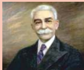
Pierre de Coubertin zakladateľ novodobých olympijských hier

"Olympijská idea preniká ako slnečný lúč cez hmlu a prekračuje svah dvadsiateho storočia ako odraz žiarivej nádeje. ...Hovorím o hnutí zrozenom večnou túžbou človeka po mieri a bratstve. Mier sa stal akýmsi náboženstvom, pri jeho oltári sa zhromažďujú čoraz väčšie masy veriacich..."